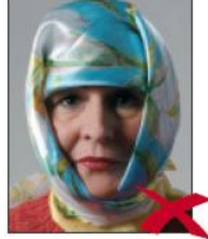
Yüzünde Gölge Var