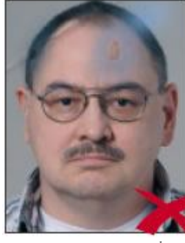
Karışık ve Mürekkep İzi Var