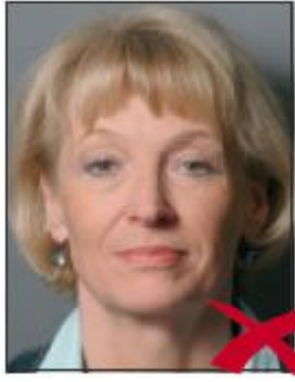
Arka ton Gölgeli

Arka fon tek renk, açık, desensiz (tercihen nötr gri tonda) olmalı. Yüze ve saçlara iyi bir kontrast oluşturmalı. Açık renk saçlarda mümkünse orta tonda bir gri, koyu renk saçlarda açık gri arka fon olmalı. Resim üzerinde sadece kişinin kendisi görülmeli, (başka kişiler veya objeler resimde yer almamalı, özellikle küçük çocuklarda dikkat edilmeli.) Arka fonda gölgeler oluşmamalı.