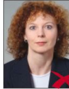
Yüz hatları belirgin değil