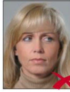
Gözler Yana Bakıyor