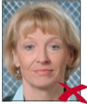
Arka ton Uyun Değil