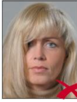
Saçlar Yüzü Kapatmış