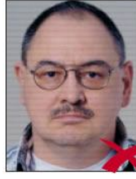
Görüntü Kalitesi Düşük