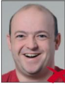
Ağız Çok Açık

Başın öne eğik veya herhangi bir tarafa dönük (yarı profil) olması kabul edilmez. Kişi nötr bir yüz ifadesi ile ağzı kapalı olarak ve doğrudan kameraya bakarken resmi çekilmelidir.