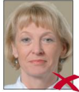
Arka Ton Silik